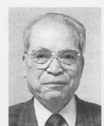
元練習帆船日本丸船長 元東京商船大学教授